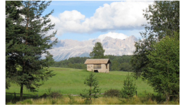
..auch die kleinste Hütte will gemanagt sein!