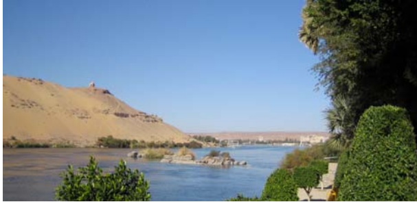
... die Fähigkeit, kontrastreich zu denken entfalten.