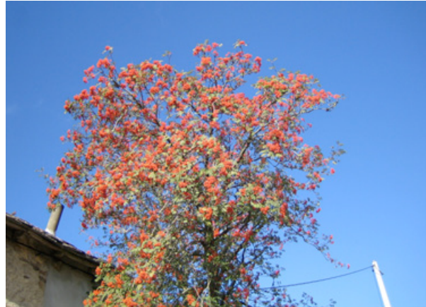
...flexibel und geschmeidig wie die Natur.