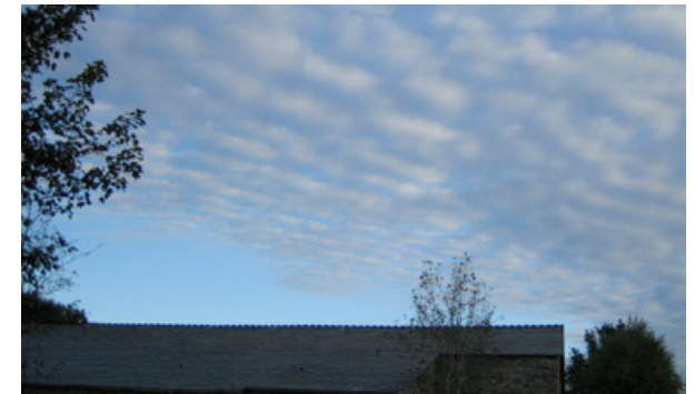
... Strukturen erkennen.

Gute Planungen gelingen nur, wenn Synergien erreicht werden, was nur in einer offenen, interdisziplinären Arbeitsweise möglich ist. Nur so sind mehr Kreativität und eine geringere Fehlerquote zu generieren. Genaue Bedarfsanalysen und Ablaufstudien, sowie detaillierte und transparent erfasste Programme bilden eine solide Basis.