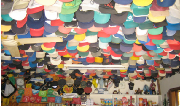
...ein Himmel voller Käppis, Kneippe am Jakobsweg in Spanien.