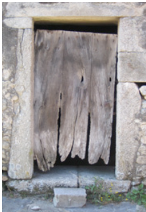
... nachhaltige Materialwahl.