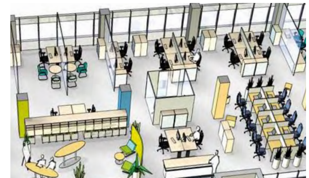
... neue, offene Bürokonzepte.

trägt erheblich zur Effizienzsteigerung bei. Konzentration und Übersicht ergänzen dabei die Teamarbeit. Die Möbel müssen diesen Prozess durch ihre flexible Handhabung unterstützen.