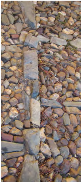
Flußsteinpflaster in Galizien, E.

Mit modularen Ansätzen versuchen wir eine höchstmögliche Überdeckung zu erreichen.