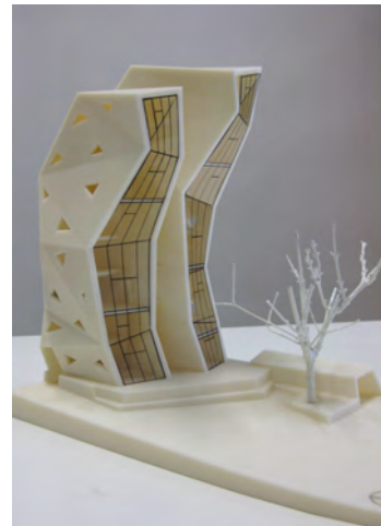
..das Drachenhaus, Studie, Ljubljana 2008

und immer auf dem neuesten Stand der Technik. Wir plotten Ihnen alles, komplexe Formen werden in kürzester Zeit erstellt mit dem 3D-Plotter. 3D-Animationen + 3D-Darstellungen sind heute selbstverständlich.