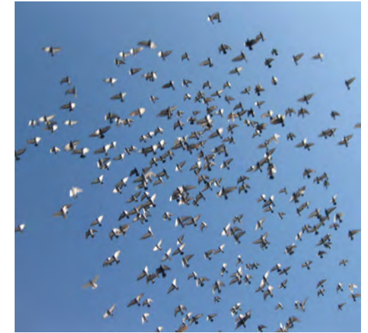
... Tauben über dem Piata Mare in Hermannstadt (Sibiu) RO

Intuitives Zusammenwirken wie in einem Schwarm, getragen von Sichtkommunikation und Übersicht; das ist die Voraussetzung für gutes Teamwork. Dazu sind regelmäßige Veränderungen nötig gerade im Büroumfeld, wo sich Verkrustungen nicht nur im Handeln sondern auch in den Räumen und Möbeln einstellen.