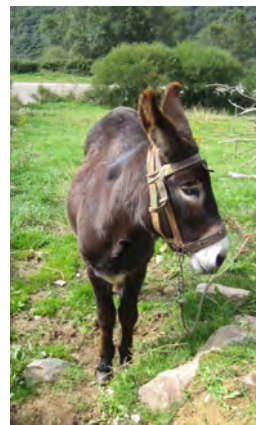
... stetig und mit Bedacht.