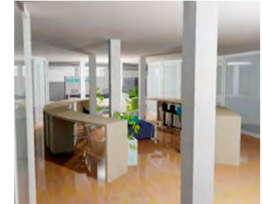
... zeitgemäße Kommunikationszone